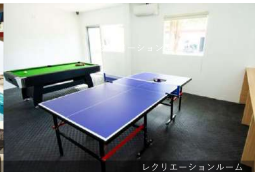
レクリエーションルーム